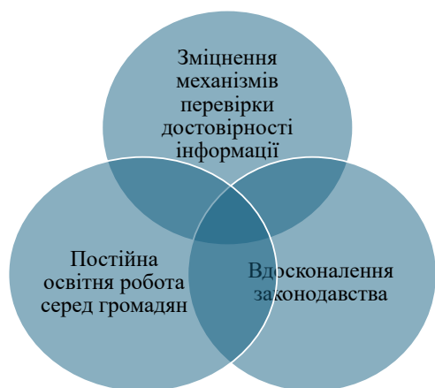
Рис. 3. Шляхи протидії дезінформації

ції. Необхідно підтримувати незаангажовані та незалежні медіа, які здатні об'єктивно та професійно висвітлювати події, а також контролювати владу та інші соціальні інституції. Підтримка журналістської етики та свободи слова є ключовим елементом у забезпеченні інформаційної безпеки та демократії.